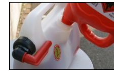
Grosse Einfüllöffnung für einfaches Befüllen