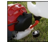
Zugang auch bei schwierigen Tanks