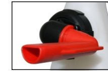
Einfüllstutzen auch für kleinste Tanks. Mit Abflachung zur Einsicht und gute Entlüftung beim Tanken.