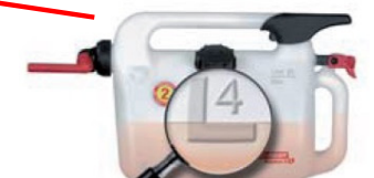
Skala beim Befüllen