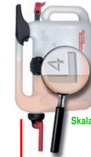
Skala beim Tanken